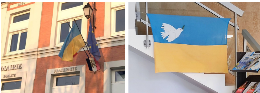
En signe de soutien au peuple ukrainien, le maire se pare aux couleurs de l'Ukraine.

Faites-vous connaître en mairie afin de pouvoir prendre contact et faire communiquer les familles en cas d'accueil de celles-ci.